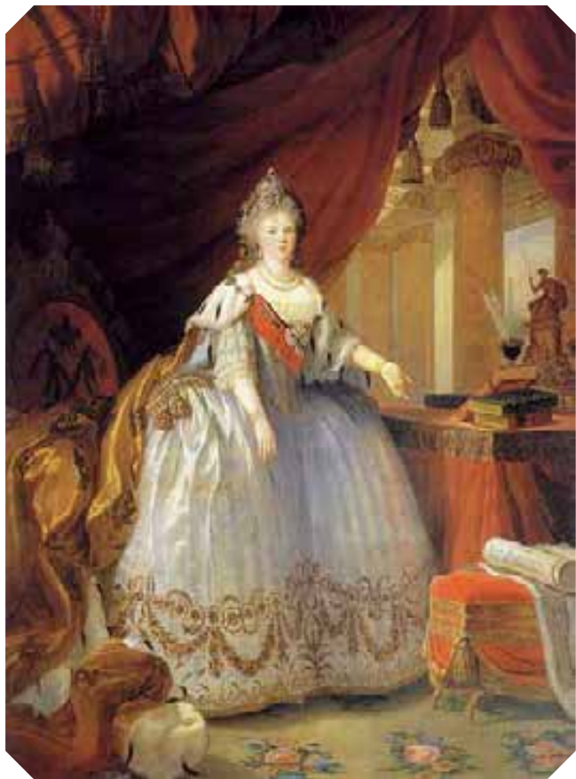
Портрет Императрицы Марии Федоровны