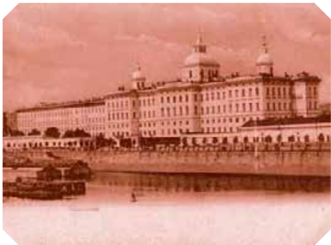
Московский Воспитательный Дом