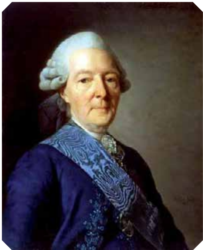
Портрет И.И. Бецкого