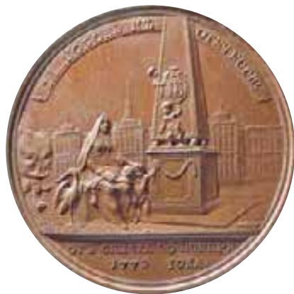
Лицевая и оборотная стороны настольной медали в честь И.И. Бецкого

Бронза, диаметр 65 мм, XVIII в. Частная коллекция. На фото уменьшена