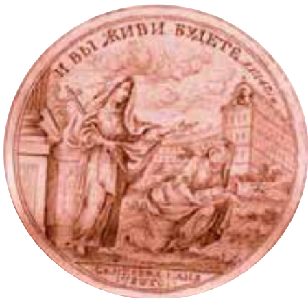
Лицевая и оборотная стороны настойной медали Воспитательного Дома