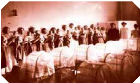
Грудное отделение Санкт-Петербургского Воспитательного Дома Фотоателье К.К. Буллы, 1913 г.