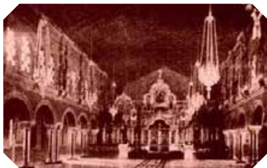
Интерьер церкви св. равноапостольной Марии Магдалины Санкт-Петербургского Воспитательного Дома