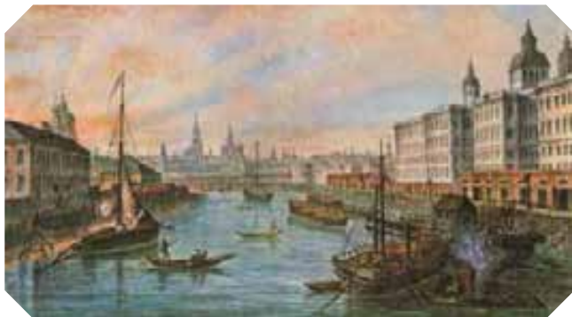
Московский Воспитательный Дом (справа)

Акварель мастерской Ф. Алексеева, нач. XIX в.