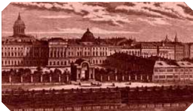
Здания Санкт-Петербургского Воспитательного Дома на набережной реки Мойки

Акварель мастерской Ф. Алексеева, нач. XIX в.