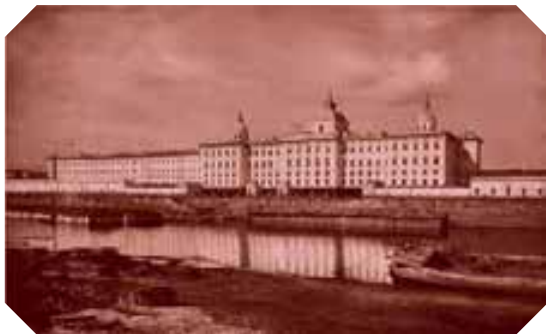
Московский Воспитательный Дом — самая крупная постройка в дореволюционной Москве Длина фасада 379 м Фото до 1917 г.