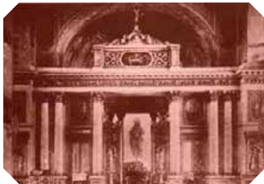
Внутренний вид церкви св. влмц. Екатерины Московского Воспитательного Дома