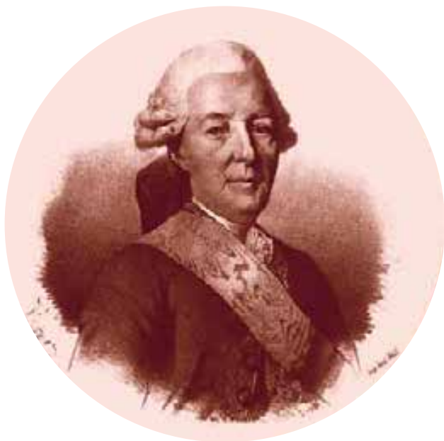
Действительный тайный советник Иван Иванович Бецкой