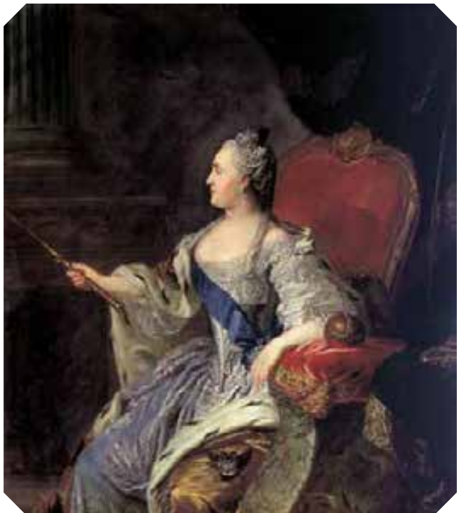
Портрет Императрицы Екатерины II из собрания Московского Воспитательного Дома